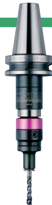
BT40-ECP412 + TCA412-S

※Models marked with ☆ may require a longer delivery term because they are based on per-order production. ※L0 should only be considered for model TCA-S. When using other models, L0 should be calculated as L1+H1. (cf. P09) ※☆の型式は受注生産のため納期までに時間がかかる場合があります。ご了承下さい。 ※L0寸法は、TCA-S型装着時のものです。その他は(L1+H1)にて算出下さい。(P09参照)