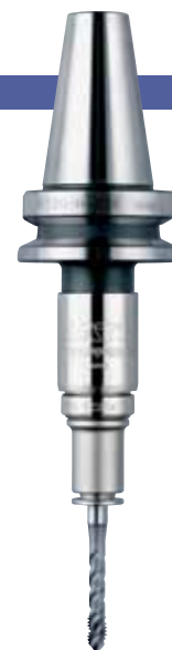
BT30-HA206-M + TC206-M