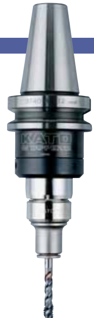
BT40-RA412-M + TC412-MO