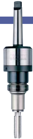
MT3-RA1022 + TC1022