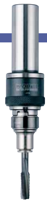
ST32-SA412-VI + TC412

※Models marked with ☆ may require a longer delivery term because they are based on per-order production. ※☆の型は受注生産のため納期までに時間がかかる場合があります。ご了承下さい。