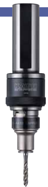
STT32-SA412-VI + TC412