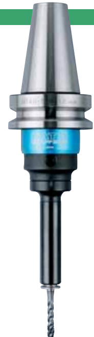
BT40-SKB412 + TCA412-M