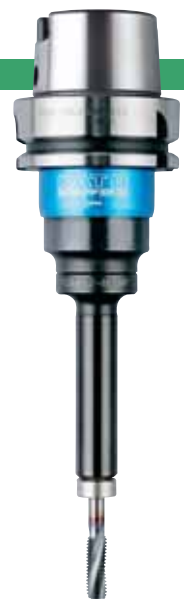
HSK-A63-SKB412 + TCA412-M-HP-SB